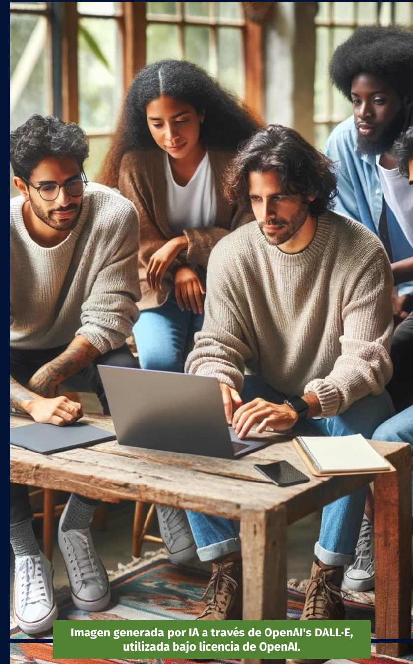
Imagen generada por IA a través de OpenAI's DALL-E, utilizada bajo licencia de OpenAI.